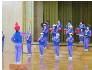
< 5、6年生による演奏 >

今年は、5、6年生が合同で「アフリカンシンフォニー」の演奏を行い、引継ぎ式を行いました。3、4年生が体育館で演奏を聴き、1、2年生は、各教室からの参加となりました。子供たちにとっては聴き慣れた親しみのある曲でした。演奏の後6年生から5年生の代表に、指揮者の指揮杖と指揮帽が渡されました。毎年、短い時間の式ですが、6年生の思いが5年生以下の下級生にしっかりバトンタッチされました。5年生は、一年間リーダーとしての自覚をもって取り組んでいってほしいと思います。