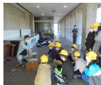
<6年 埋蔵文化センター>