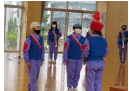
< 指揮帽と指揮杖の引継ぎ >