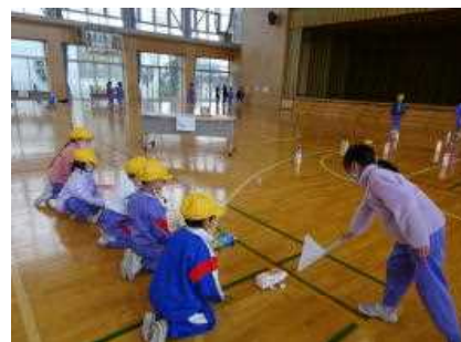
<1、2年 じっくりおもちゃランド>

こうした校外学習や体験学習、専門の方の話を聴くこと、他の学年との交流学习等の活動を継続して行うことで、子供たち一人一人に学ぶ楽しさや交流することのよさ、すばらしさを実感してもらいたいと思います。ご家庭でも、こうした活動や学校の日々の活動について話題にされたり、子供たち自身が感じ取ったことや考えたことについて共感し声をかけたりしていただければと思います。よろしくお願いいたします。