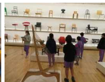
<5年 美術館・ワンダーランド>