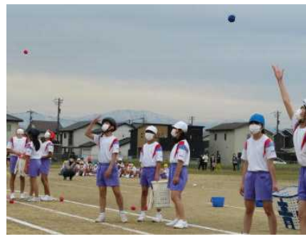
< 入れろ！チャンスの玉 >