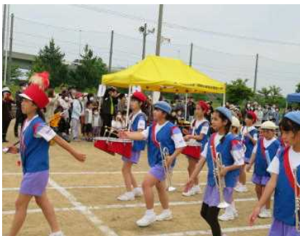
< 鼓笛演奏 >