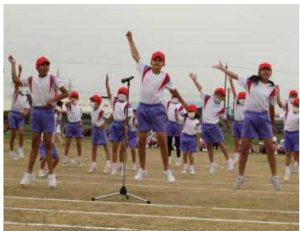
< 応援コール >

今年もコロナ禍での開催となりましたが、県内の感染状況から保護者等、来校者の人数制限を行いませんでした。また、地域から学校評議員の方をお迎えしました。今年の運動会のスローガンは、「団結し、楽しもう！出し切ろう、堀岡っ子の超フルパワー！」でした。各学年の個走や下学年のかわいいダンスを交えた玉入れ、上学年の伝統の鼓笛演奏、スローガンそのものを引き継いだ全校競技、リレー等、どれも見ごたえがありました。特に個走では、各学年の最高タイムの記録測定を行い、来年以降の学年の子供たちの目指すタイムとしました。また、6年生が応援コール等の競技だけでなく係活動でもリーダーシップを発揮して12人一人一人が自分の役割を自覚し、一生懸命活動している姿に成長を感じました。保護者や地域の皆様からの子供たちの競技や演技に多大なる拍手によるご声援ありがとうございました。また、PTA執行部、役員の皆様には、早朝よりスローガンの掲示や入場門やテントの設営、受付にとご協力いただきました。本当にありがとうございました。