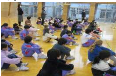
<演奏を聞く3年生～5年生>

鼓笛隊の楽器や衣装は、現在の校舎が建築された折に小学校の卒業生の方から寄贈されました。子供たちにいろいろな活動をさせたいという願いや思いがこもっています。こうした思いも引き継ぎ、リーダーとしての自覚を高めていってほしいと思います。