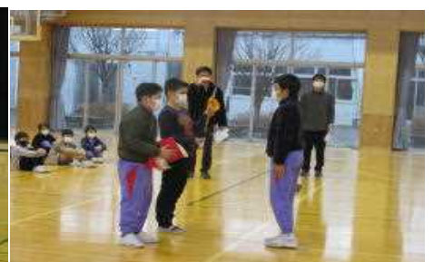
<6年生から5年生への引継ぎ>