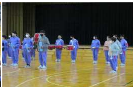
<6年生の校歌の演奏>