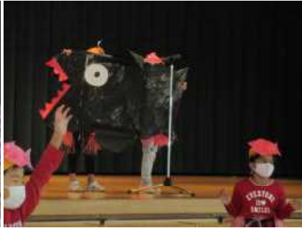
< 2年 スイミー >