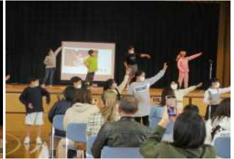
< 3年カラフル！～あつまれ子供たち～ >