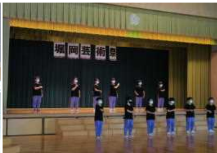
< 5年 堀岡芸術祭 >