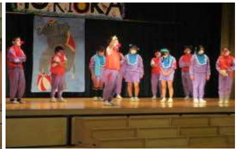
< 6年 ブランコ乗りとピエロ >