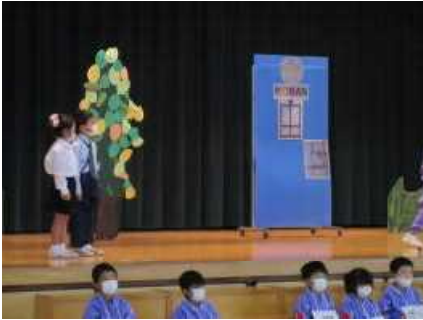
< 1年 にている親子 にてない親子 >

今年のテーマは、 ～届けよう 笑顔 みんなの成長の花をさかせ 輝く最高のステージを！～ です。昨年同様、学習した内容を表現する場として行いました。当日は、新型コロナウイルス感染症対策の観点から家族2名の参加でしたが、会場の心温まる拍手に子供たちも勇気付けられたことと思います。ありがとうございました。どの学年の子供たちもテーマ通り、練習の成果を十分発揮していました。何よりも一人一人の子供たちがしっかりと顔を上げ、堂々と台詞を言ったり、演技や演奏を行ったりしている姿に感動しました。堀岡っ子の可能性を実感するとともに頼もしく感じました。