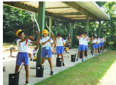
精神を統一し、弓を引き絞ってねらいを定めたアーチェリー。静けさの中の張りつめた緊張感が素敵でした。