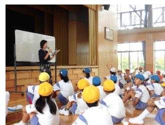
チームタイムで話し合い、準備を進めています。

一昨年度の西部地区、昨年度の東部地区に引き続き、今年度も10月3日(木)(雨天順延)に中央地区で「こども110番の家」を巡る「堀岡ウォーク」を計画しています。3か年計画3年目の今回は、午前中に「こども110番の家」(15軒)と富山新港火力発電所を巡り、午後は、元気の森公園で昼食を食べ、ネイチャーゲームを楽しむ予定です。縦割り班で活動することで互いに協力して目標を達成しようとする協力を養うとともに、地域を巡ることで地域のよさや、地域のみなさんに支えられ、守られていることを改めて実感することで、自分も地域のために役立とうとする態度を養う機会にしていきたいと考えています。お訪ねする「こども110番の家」のみなさまにおかれましては、お願いが届いていることと思っておりますが、よろしくお願ひします。また、子供たちを見かけましたら、お声をかけていただけるとありがたく思います。