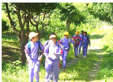
地図をたよりにポイントを探したオリエンテーリング。森の中ではあやうく迷子になりそうでした。

真夏のような残暑厳しい二日間でしたが、子供たちは、自分のことは自分ですること、仲間と協力すること、精一杯活動を楽しむことなど、集団生活を通じて充実した学びを経験してきました。互いを思いやりながら、学年を超えて力を合わせて活動することで、学校のリーダーとしての信頼の絆がさらに深まりました。