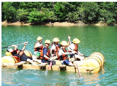
自分たちで作ったいかだに乗りこみ、いざ出発。本当に進むのかな。でも慣れてくるとどんどん沖へ漕ぎ出していました。